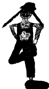
Rechte Hacke berührt linke Hand hinterm Körper