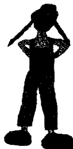
Einmal um die eigene Achse drehen