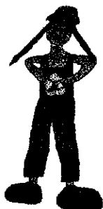
Vier mal klatschen