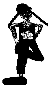
Linke Hacke berührt rechte Hand hinterm Körper